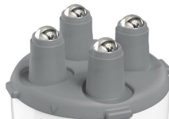
ローラーアタッチメント

速度を3段階から選べ、お好みの強さ*で顔周りや首、肩、デコルテにご使用いただけます。