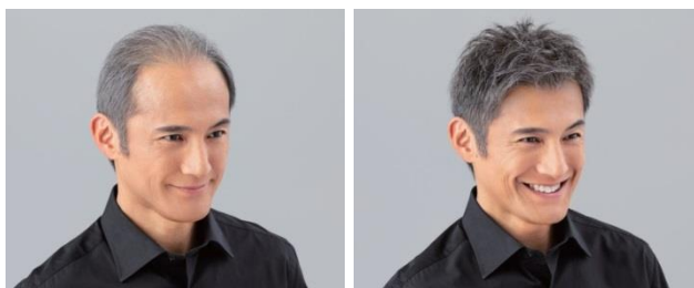
(ヘア・フォーライフ 増毛例)