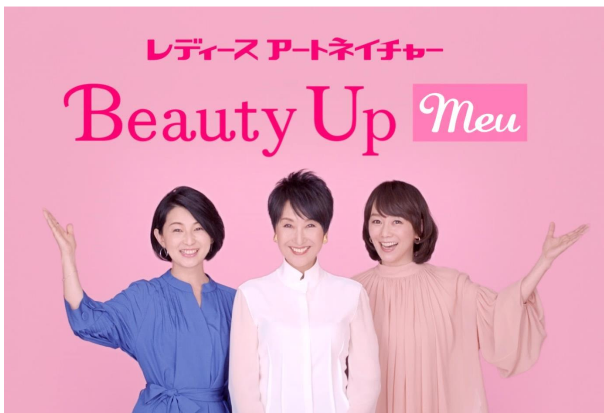
CM「ビューティアップ先輩」篇より