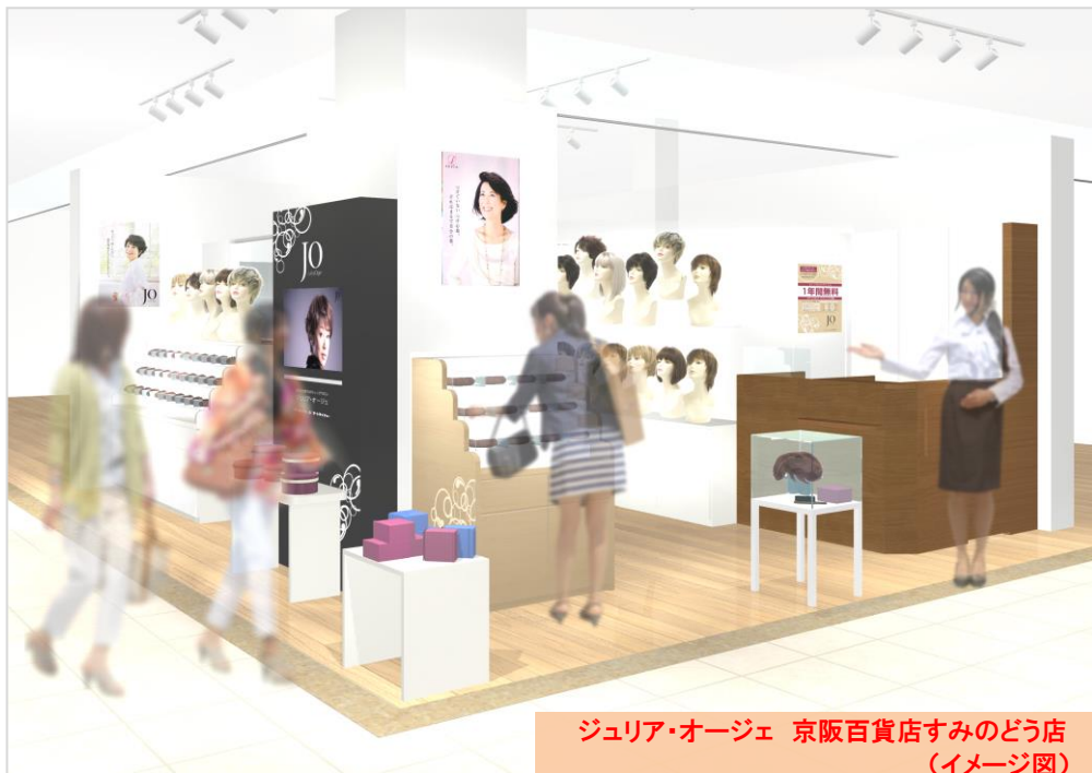
ジュリア・オージェ 京阪百貨店すみのどう店 (イメージ図)

ファッション&ビューティをテーマとした2階フロアに新規オープンする「ジュリア・オージェ 京阪百貨店すみのどう店」は、近隣にお住まいの幅広い世代の方々に満足いただけるよう、自毛を活かしながらボリュームをプラスする人気の部分ウィッグをはじめ、簡単にイメージチェンジが楽しめるオールウィッグなど、豊富な商品ラインアップときめ細かなサービスでお客様をお迎えいたします。