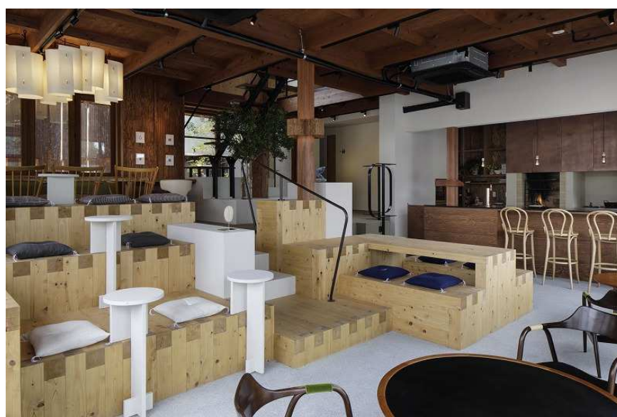
Living Room (ラウンジスペース)。右手のカウンターは「Minatoya」

1階中央に位置するのは、地域住民や旅行者の休憩の場や学生の勉強場所として、誰もが自由に利用できるフリースペースです。ここではワークショップの開催、映画の上映などを計画しています。電源や Free Wifi も完備しているためワークスペースとしても活用でき、また SOIL SETODA 館内や商店街で購入したテイクアウトメニューの飲食も可能です。