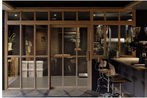
Overview Coffee ロースター（左）