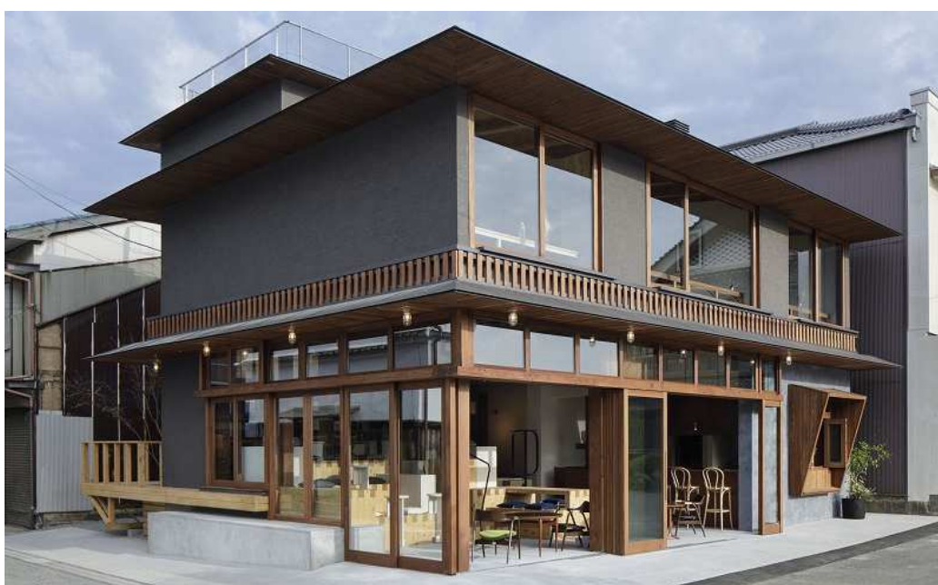
SOIL SETODA LIVING 外観

訪れた全ての人にとっての居場所となる「街のリビングルーム」のような役割として、旅行者と地域住民がインタラクティブに時間や経験を共有し、活発で和やかなコミュニケーションが生まれる空間を目指しています。