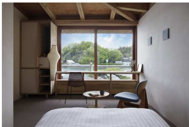
プライベートルーム