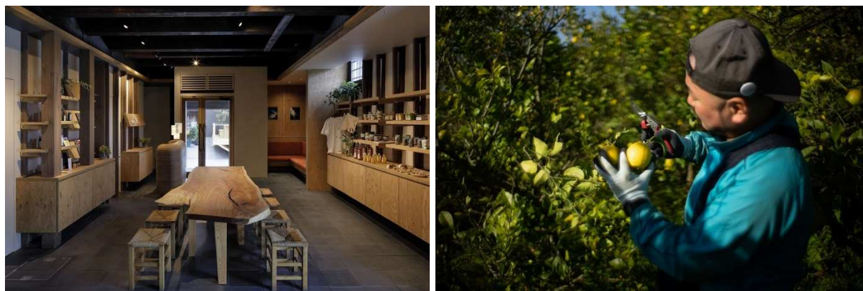
SOIL SETODA KURA 内のアクティビティセンター（左）と自然農法レモンの収穫体験イメージ（左）