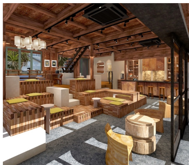
SOIL LIVING（左）の外観イメージと SOIL KURA（右）の内観イメージ