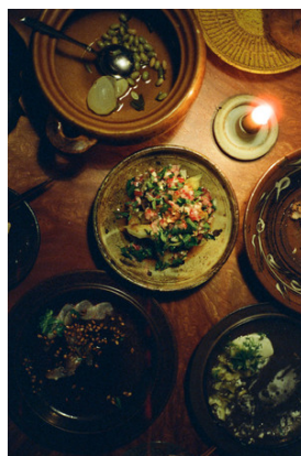
Minatoya のロゴと提供料理のイメージ写真