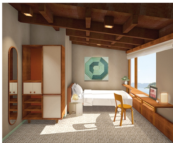
プライベートルームの完成予想図