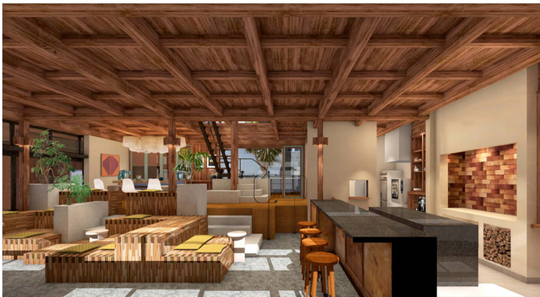
Living Room（ラウンジスペース）の完成予想図。右手のカウンターは「Minatoya」。

1階中央に位置するのは、地域住民や旅行者の休憩の場や学生の勉強スペースとして、誰もが自由に利用できるフリースペースです。ここではワークショップの開催、映画の上映などを計画しています。電源やFree Wifiも完備しているためワークスペースとしても活用可能で、またSOIL SETODA 館内や商店街で購入したテイクアウトメニューの飲食も可能です。