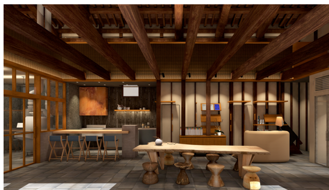
内観パース。右手奥にあるカウンターが「Activity Center」。