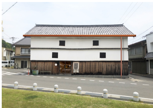
SOIL SETODA KURA の外観イメージ。

SOIL SETODA KURA 1階のアクティビティーセンターでは、瀬戸田レモンの収穫体験や料理教室、釣りツアー、マリンアクティビティーなど瀬戸田の魅力を体験できるツアーを提供します。専属スタッフがコーディネーターとなり地域住民の方々が得意なことをアクティビティーとして提供することで、旅行者と地域住民が交流するきっかけを創出します。また、瀬戸田エリアのマップ配布等、観光案内所の機能も有します。