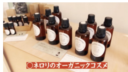
○ネロリのオーガニックコスメ