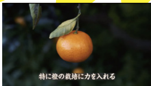
特に橙の栽培に力を入れる

長崎県は、2020年12月4日(金)より、PR動画「ながさき移住倶楽部 新入部員募集第2弾」である「爽やかすぎる海辺の柑橘ファーマー山辺部員ver.」を公開いたします。本動画は、長崎県へのUターン・Iターン促進を目的として制作しました。長崎県で暮らす魅力を、熱血部活動紹介に見立て、インパクト強めに紹介しております。