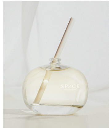
03. Delightful Earl Grey