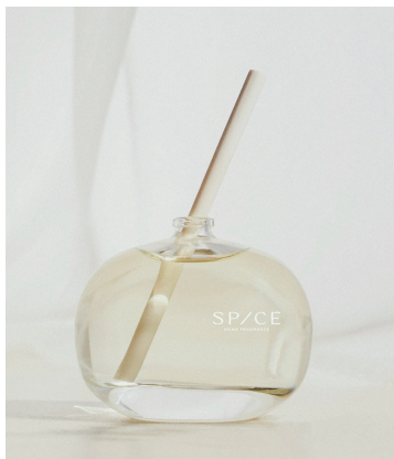
01. Your Story

グリーンやフレッシュな柑橘を纏った香り高い紅茶に、透明感のあるムスクとジャスミン、ローズが優雅さを与えた気品のある香り。空間を穏やかに、フレッシュで爽やかにします。