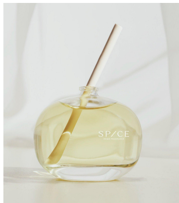
02. Social Sunshine