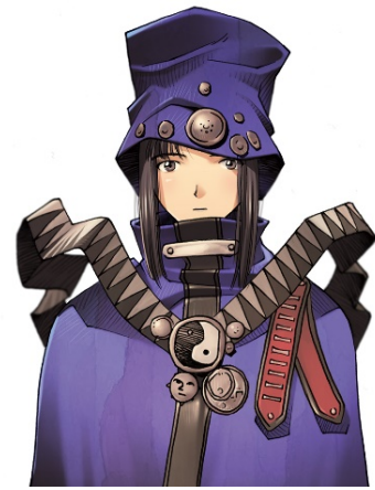
『ブギーポップは笑わない』 イラスト／緒方剛志