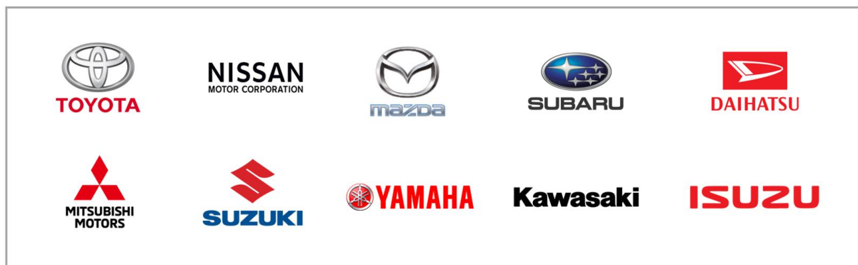
SDLコンソーシアム日本分科会に参加する自動車メーカー10社

SDLアプリコンテスト実行委員会は、SmartDeviceLink（以下SDL）に対応するアプリを広く募集する、「クルマとスマホがつながる SDLアプリコンテスト」を開催いたします。本コンテストは、自動車メーカー10社（トヨタ自動車、日産自動車、マツダ、SUBARU、ダイハツ工業、三菱自動車工業、スズキ、ヤマハ発動機、川崎重工業、いすゞ自動車）ほかで構成される、SDLの普及を目的とした団体SDLコンソーシアム日本分科会の協力で実施するものです。