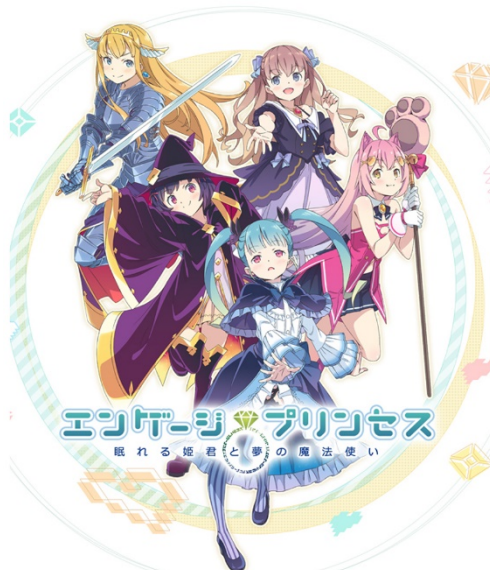
イラスト/かんだきひろ

電撃文庫とniconicoがタッグを組み、原作・メインストーリーを伏見つかさが、メインキャラクターデザイン・イラストをかんだきひろが担当するラブコメRPG『エンゲージプリンセス』が、2018年夏のリリースに向け、事前登録キャンペーンを実施中です。公式サイトでは、『エンゲージプリンセス』メインビジュアルに加え、作品のストーリーや5名のメインキャラクターの詳細・担当声優を公開。第2弾となるPVもご覧いただけます。