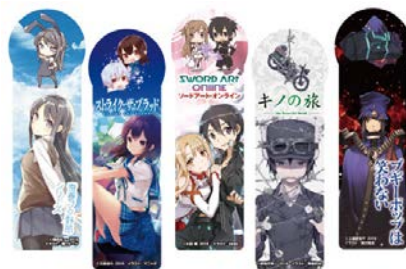
「電撃文庫クリアしおり」イメージ

「電撃文庫MAGAZINE Vol.61」と「電撃文庫MAGAZINE Vol.62」では、「電撃文庫クリアしおり」が付録に登場します。さらに、「電撃文庫MAGAZINE Vol.63」(8月10日発売予定)の付録は、これまで電撃文庫MAGAZINEを彩ってきたアニメイラストを集めた「版權イラスト画集」を予定しております。