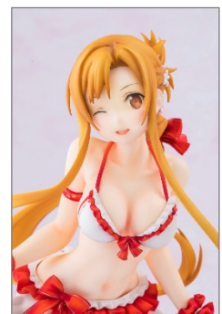
『SAO』アスナフィギュアイメージ