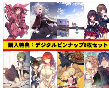
ピンナップイラスト集イメージ

※電子版と紙版で発売日が異なります。電子版は偶数月25日ごろ配信予定となります。