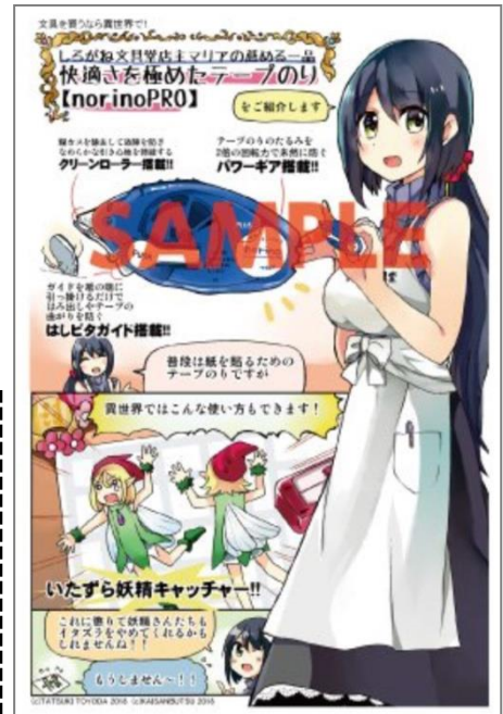
↑ 三洋堂書店購入特典ペーパー

【プラス ステーションナリー公式サイト】 https://bungu.plus.co.jp/