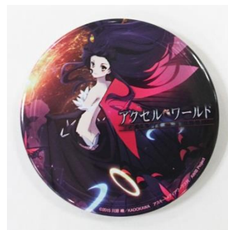
↑ 特製缶バッジイメージ

©2015 川原 礫/KADOKAWA アスキー・メディアワークス刊/AWIB Project