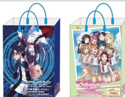
特製ショッパーイメージ →

1会計3,000円以上ご購入された方に、特製ショッパー(片面は『ソードアート・オンライン』、片面は『ラブライブ！サンシャイン!!』)を先着順でプレゼントいたします。