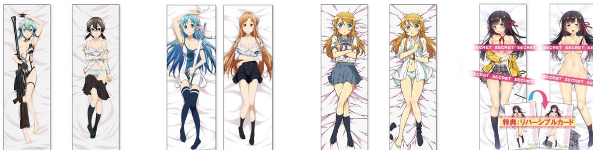
↑ 抱き枕カバーイメージ

電撃ヒロインのちょっとエッチな抱き枕カバーを蔵出し・復刻など豪華ラインナップでお届けします。