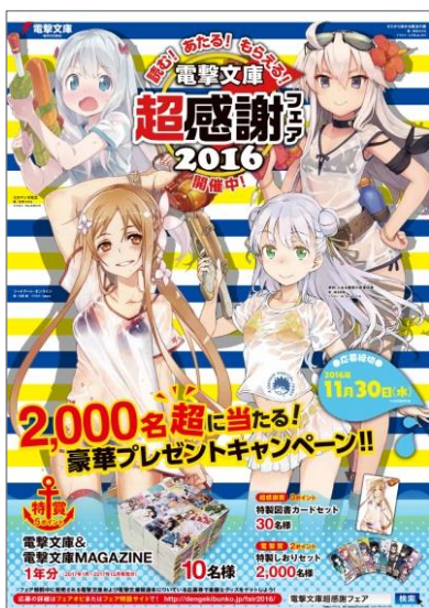
8月のフェアポスター画像

電撃文庫の公式ファンクラブ「電撃文庫CLUB」では、フェア期間中に電撃文庫や電撃コミックスの電子書籍を週替わりでセールいたします。またセール対象品の購入者全員に、オリジナル電子小冊子『電撃文庫 超感謝フェア2016 ポスターコレクション』をプレゼントいたします。