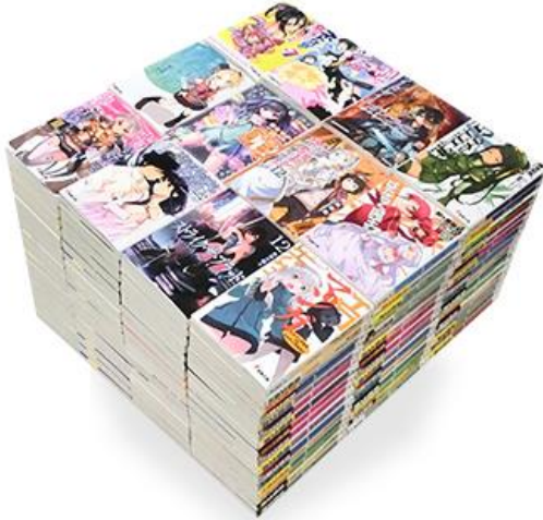
※画像は電撃文庫1年分のイメージです