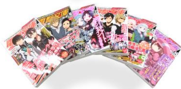
※画像は電撃文庫MAGAZINE1年分のイメージです