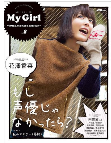
“面押し”ガールズビジュアルブック My Girl