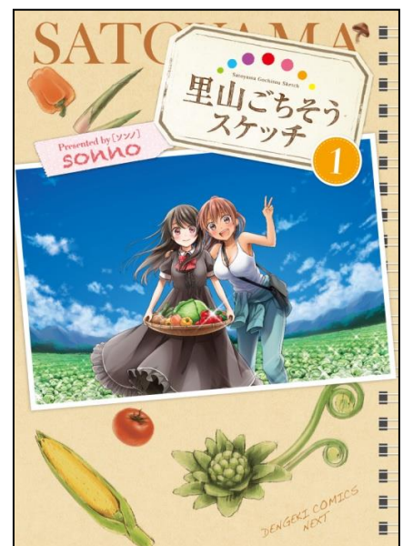
↑『里山ごちそうスケッチ』①表紙

都会から里山に引っ越してきたコミュ障気味の画家・杏(あんず)。脳内で食べ物を女の子に擬人化してしまう彼女の料理には、刺激的な“可愛さ”が満ち溢れていた……!! ニヤニヤ、ぴっくり、時々ほっこり、里山お料理らいふ★