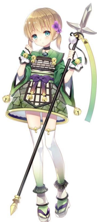
小諸城(CV:松田颯水) イラスト:和錆

「はい。行ってきます。がんばります。で、でも、もし逃げても、怒らないでくださいね……あの釣り野伏せとか怖いですし……。」