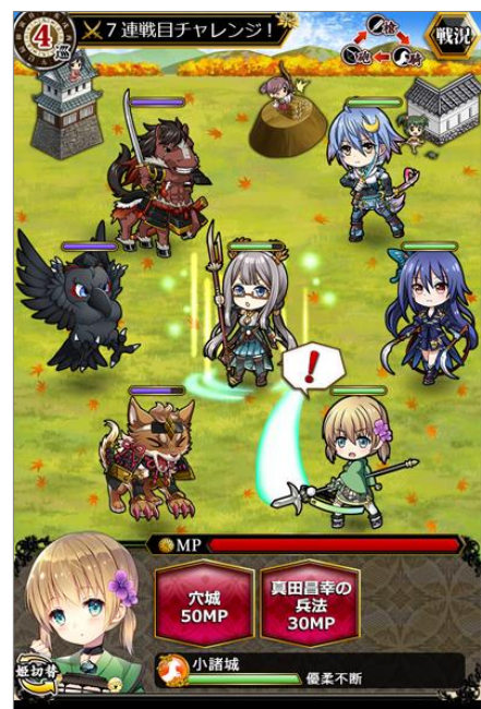
↑新機能「連戦チャレンジ」イメージ

※内容は変更する可能性がありますので、あらかじめご了承ください。 ※詳細はゲーム内をご確認ください。