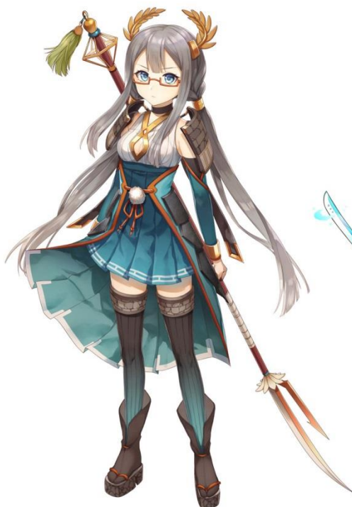
篠山城(CV:諏訪彩花) イラスト:トマリ

「はい。行ってきます。がんばります。で、でも、もし逃げても、怒らないでくださいね……あの釣り野伏せとか怖いですし……。」