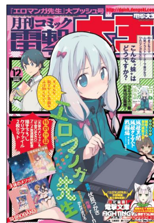
↑「月刊コミック電撃大王」 2014年12月号表紙

●月刊コミック電撃大王公式サイト： http://daioh.dengeki.com/