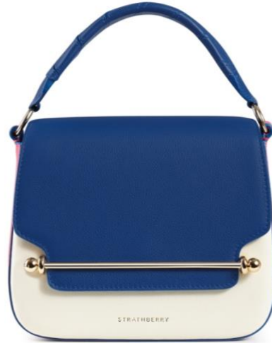
エース バニラ、コバルト、フラミンゴ 78000 円(税、送料込)

スペイン産の最高級のレザーを使用し、1点ずつスペインの熟練工が手作り。スポーティさとエレガンスを兼ね備えた、大坂選手のデザインやファッションへの愛を反映したミニコレクションに仕上がりました。