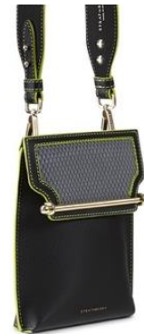
アレグロミニ バニラ、コバルト、フラミンゴ 74000 円(税込) アレグロマイクロ バニラ、シルバー、メープル 62000 円(税込) ノースサウス ブラック、ライム、シルバー 53500 円(税込)