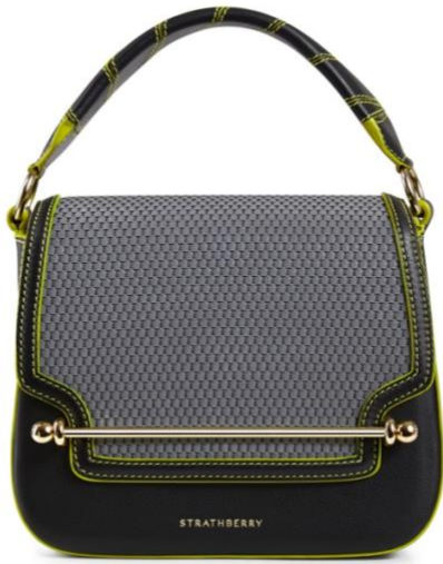
エース ブラック、ライム、シルバー 93000 円(税、送料込)