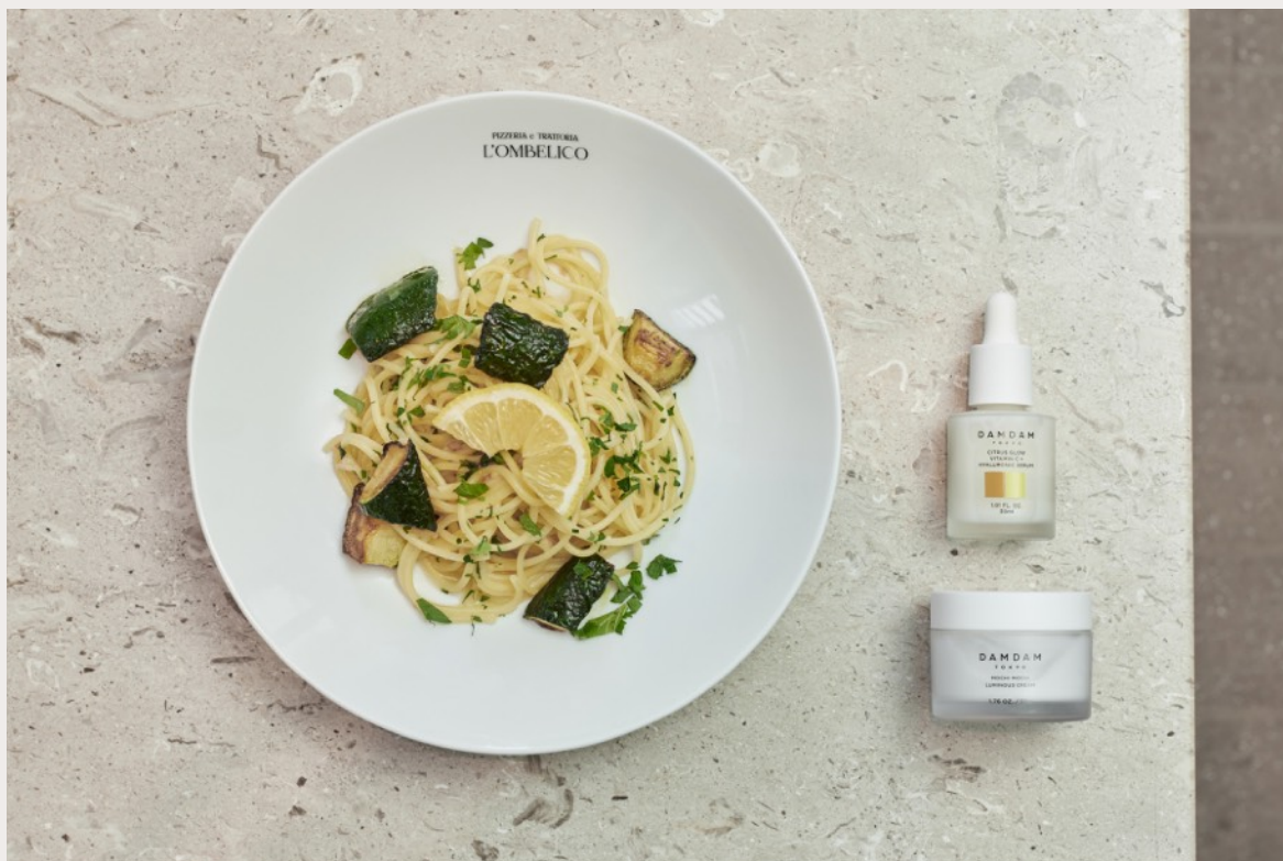
シソズッキーニのリモーネパスタ ¥2,300 ※17:00～提供予定