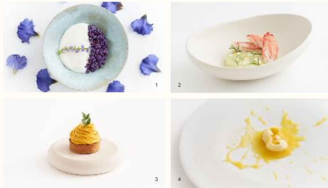
1. JGクラシック チョコレート プディング バイオレット キャンディー、2. 蟹、新米のリゾット、3. 甘夏モンブラン、4.甘夏エクスプローション

同ホテル内のレストラン「Jean-Georges at The Shinmonzen」では期間限定でコラボレーションした特別ランチコースとデザートメニューをご用意。世界的な三つ星モダンフレンチの巨匠シェフ、ジャン＝ジョルジュ・ヴォンゲリステン氏によるDAMDAM TOKYOのプロダクトに使用される4つのキー成分「シソ」「甘夏」「米」「こんにゃく」からインスパイアを受けた創造性溢れるメニューが揃います。