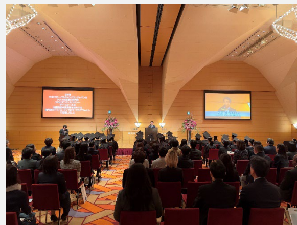
2023年度DDP修了式の様子。東京アメリカンクラブにて

留学生として受験をすると大学ごとに違った手続きなどがあり現地の知り合いに聞いてもわからないことが多かったですが、InGenius Prepの先生方は各国ごとにどのような書類が必要なのか把握し、詳しく調べて下さったことで多くの時間をエッセイなどに集中できました。海外大学受験において欠かせない存在でした。