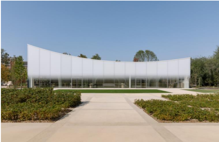
4 RUE DES CRAYÈRES /クレイエル通り 4番に誕生したパビリオン

日本人建築家 藤本壮介氏が設計、日本在住のグエナエル・ニコラ氏がインテリアデザインを担当