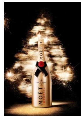
2017年ホリデーシーズン 限定パッケージ 「モエ・エ・シャンドン ゴールド スパークル」

1743年の創業以来、成功とエレガンスの象徴として愛され続けてきたモエ・エ・シャンドン。「シャンパンの魔法を世界中に」という願いのもと、洗練されたシャンパンを人々に届け、魅了してきました。モエ・エ・シャンドンは、祝福と称賛のシンボル、華やかでラグジュアリーといったシャンパンのイメージそのものを創造し、人々に定着させてきたのです。時代を超え、様々なセレブレーションシーンを彩り続けるモエ・エ・シャンドン。高い品質と豊かな泡立ち、美しく芳醇な味わいで、モエ・エ・シャンドンは270年にも及ぶ伝統を重んじながら技術革新を牽引し、未来へと続く持続可能なシャンパン造りを続けています。