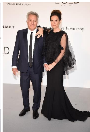
ダスティン・ホフマンと妻