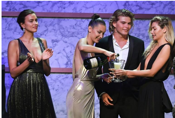
イリーナ・シェイク、ベラ・ハディッド、ジョーダン・パレット、ジェシカ・ハート