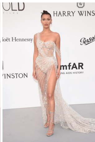
ベラ・ハディッド