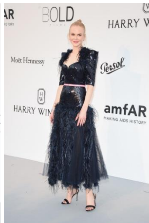
ニコール・キッドマン