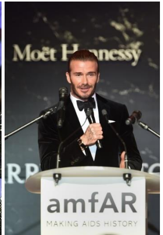
デヴィッド・ベッカム

1743 年の創業以来、成功とエレガンスの象徴として祝福の瞬間を華やかに演出してきたシャンパン メゾン、モエ・エ・シャンドンは、長きにわたり、映画界の記念すべき瞬間に欠かせない存在として数々の国際映画祭のサポートを行ってきました。記念すべき第 70 回カンヌ国際映画祭では、米国エイズ研究財団 amfAR 主催のチャリティイベント、第 24 回「Cinema Against AIDS (シネマ・アゲインスト・エイズ)」(2017 年 5 月 25 日(現地時間))のオフィシャルシャンパンに選ばれ、セレブリティたちが映画を愛し、映画に愛されるシャンパン、モエ・エ・シャンドンで祝杯をあげました。