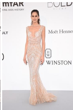
イザベル・グラーレ