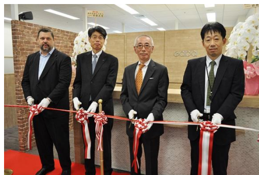
▲ オープニングセレモニーの様子

当社は法人向け英会話研修プランとして、契約先企業内に設置、運営する「スクール設置型」のサービスをご提供しています。通常のGaba LSと同等の設備を持った施設を契約企業内に設置するもので、専属のインストラクターとクライアントの英語学習をサポートするカウンセラーも常駐します。企業内にLSを設置することで業務の合間に英会話レッスンを受講することができ、効率的に英会話を学ぶことができるサービスです。