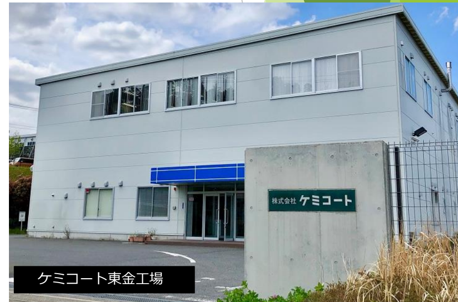
ケミコート東金工場