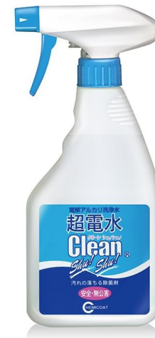
超電水クリーンシュシュ