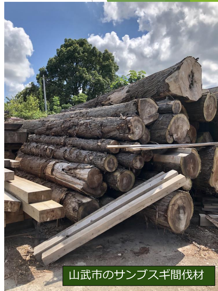
山武市のサンブスギ間伐材

山武の森の自然豊かで落ち着く香りを再現するために、香りの強い葉の部分を取り除き、木部のみの使用にこだわりました。「サンブスギ微精油」が、都会で働く人々に、故郷の原風景を呼び覚まし、日々の疲れやストレスの開放をお手伝いします。