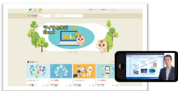
ユーザーフレンドリーなインターフェース