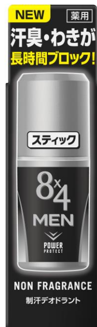
『8x4MENスティック 無香料』

ニベア花王株式会社(社長・松林正人)は、2018年2月10日、男性向け制汗剤ブランド「8x4MEN(エイト・フォーメン)」から『8x4MENスティック』を新発売いたします。この商品は、剤を繰り出し直接肌に塗って使うスティックタイプの制汗剤で、近年市場が拡大しています。