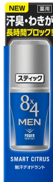
『8x4MENスティック スマートシトラス』