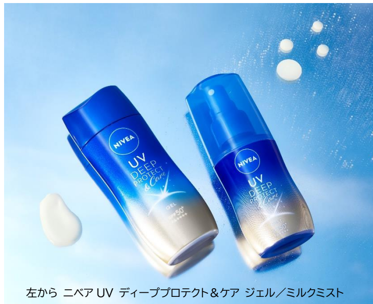
左から ニベア UV ディーププロテクト&ケア ジェル/ミルクミスト