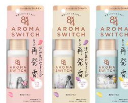
アロマスイッチ ロールオン

殺菌して一日ずっと汗ニオわせない 汗が気になるたび香りが再発香※ 気になるワキにしっかりぬれて、すっとなじむ ※機能性香料による 効能効果:皮ふ汗臭、わきが(腋臭)、制汗 【医薬部外品】