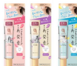
アロマスイッチ涼感ネックジェル

首のベタつきを抑え、髪の毛の張り付きを防ぎます 汗が気になるたび、新鮮な香りがはじけてさらっと涼やか ジェルが肌をまもって整えます 汗が気になるたび香りが再発香※ ※機能性香料による