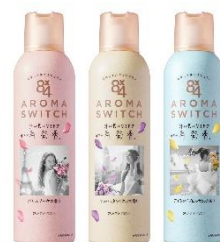
アロマスイッチスプレー

殺菌して一日ずっと汗ニオわせない 汗が気になるたび香りが再発香※ ワキやベタつきが気になるデコルテ・背中にもおすすめ ※機能性香料による 効能効果:皮ふ汗臭、わきが(腋臭)、制汗 【医薬部外品】