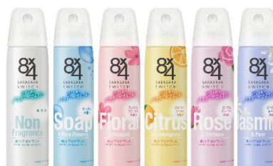
パウダースプレー