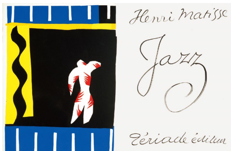
アンリ・マティス《道化師》『ジャズ』第1図、1947年刊、ステンシル／紙、ポーラ美術館

精緻な観察による描写のきめ細やかさと大胆な構図で、観る者を圧倒させるような生命力のある線の世界を描き出す切り絵アーティスト。中島美嘉のCDジャケットアートワーク、Reebokとのコラボレーションスニーカーやユニクロ「UT」への参加、直木賞作家の桐野夏生氏、木内昇氏の小説への挿画や装丁、NHK太宰治短編小説集「グッド・バイ」の映像制作、NHK「猫のしっぽカエルの手」オープニングタイトル制作などがある。お能の宝生流家元主催の「和の会」メインビジュアル担当（2008-2018）。福音館書店かがくのとも から絵本2019年7月号「むしたちのおとのせかい」、2022年11月号「からまつ — ふじさんにもりをつくるき —」を刊行。その他、国内外の個展や合同展の参加、ワークショップなど多方面で活躍中。公式サイト： http://risafukui.jp/