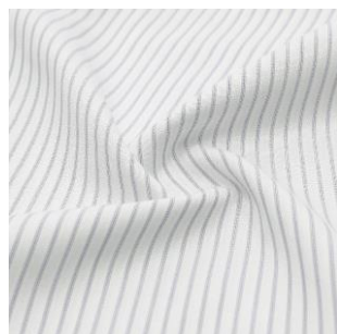
ホワイト×グレーストライプ