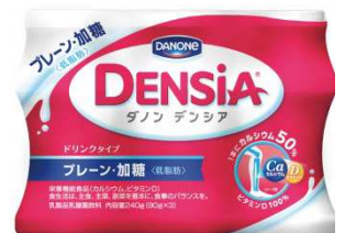
ドリンク(プレーン・加糖)