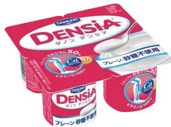
プレーン・砂糖不使用