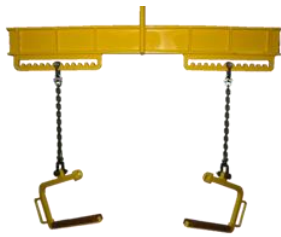
（軽量コイル吊りフック+天秤）