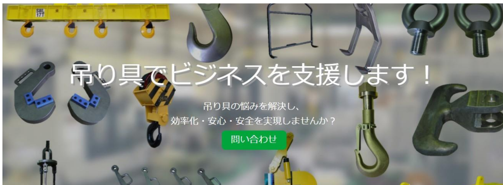
吊り具ハック サービス紹介ページ

吊り具を見直すことで、日々の作業の無駄がなくなり、生産性が向上します。毎日の作業も「塵も積もれば山となる」で、小さな改善が大きな成果につながります。また重量物の吊り作業は危険が伴うため、作業者の安全と安心した作業のために、吊り具で貢献します。