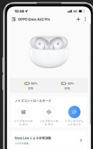
Hey Melody App