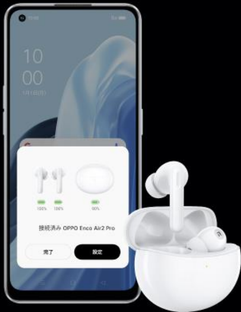
OPPOスマートフォンとの接続