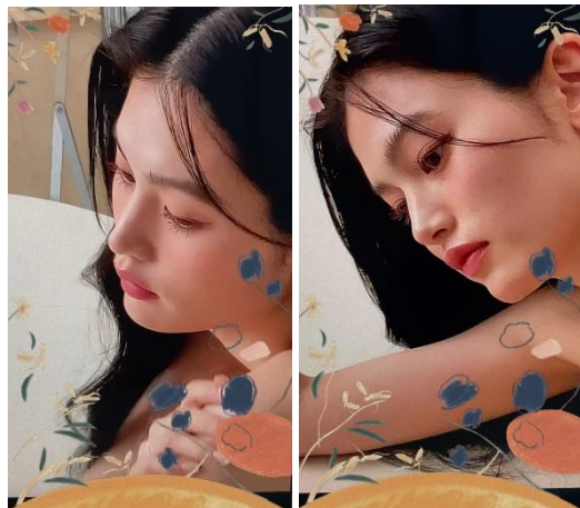
フェイスフィルターイメージ