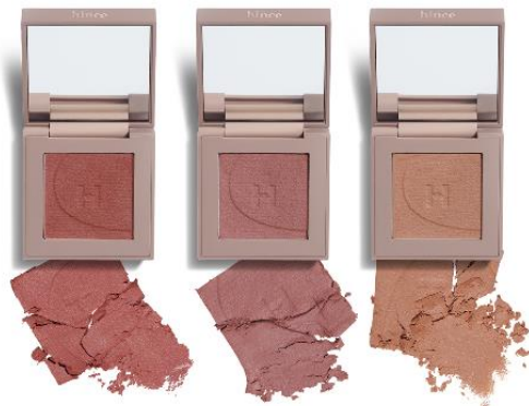
左から、ポイントアウト (SH003)、 アンフレイム (SH004)、イニシャル (SH005)