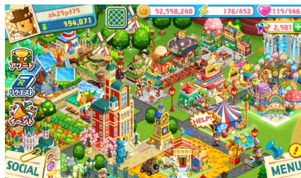
未開拓の地を自分好みにカスタマイズ