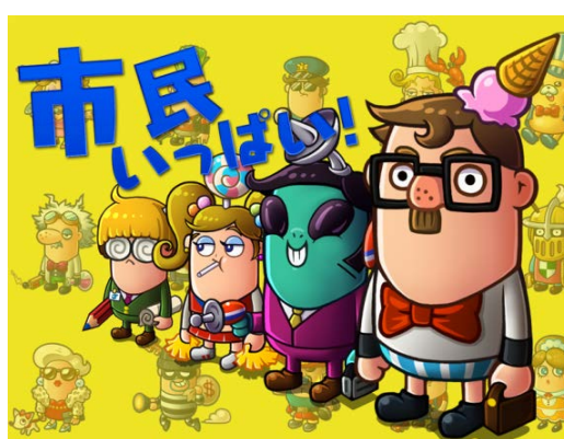
個性的なキャラクターが多数登場。タップしたときのリアクションにも注目。

住民キャラクターからの要望に応えながら街の人口を増やし、フレンドと協力してマイシティを発展させる街づくりゲーム「City Maker」に、どうぞご期待ください。