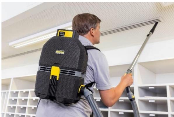
コードレス背負式クリーナー (BVL 5/1 BP)