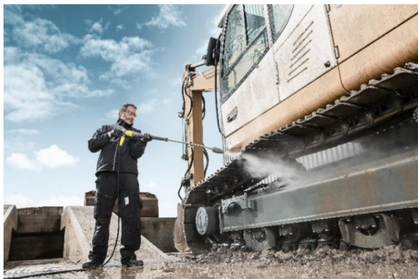
頑固な汚れも強力で洗浄する 高圧洗浄機 (HDS 1000 BE)