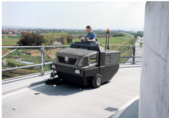
インダストリアルスイーパー (KIM 150/500 R D で 広面積を短時間で効率的に清掃)