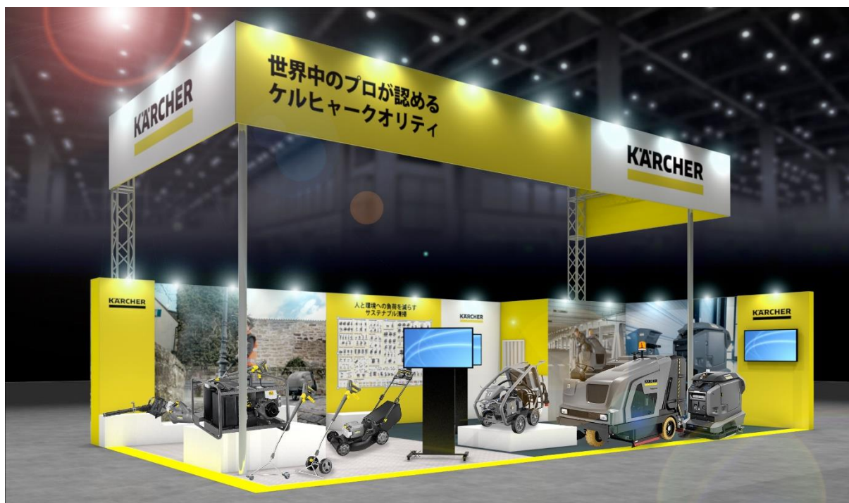
CSPI-EXPO 2023 ケルヒヤーブースイメージ

清掃機器の最大手メーカー、ドイツ・ケルヒヤー社の日本法人、ケルヒヤー ジャパン株式会社（本社：神奈川県横浜市港北区、代表取締役社長：マーク・ヴァン・インゲルゲム）は5月24日（水）～26日（金）に幕張メッセにて開催される「第5回 建設・測量生産性向上展（CSPI-EXPO 2023）」に初出展します。