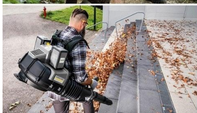
環境にやさしいながらも強力なパフォーマンスを誇るガーデンツール