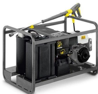
ケルヒヤーが 2022 年に商標を取得した温水除草システム®