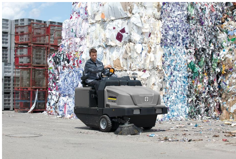
地球環境に配慮したバッテリー式インダストリアルスイーパー（KM 105/180 R Bp Classic）