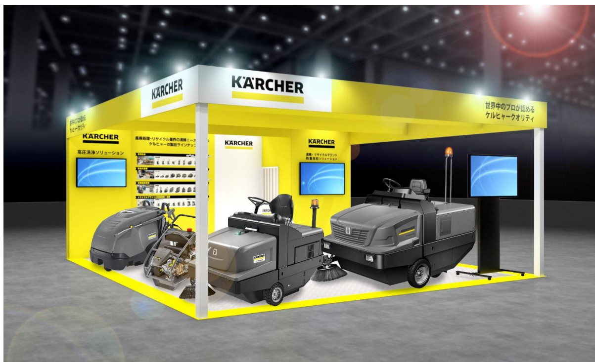
2023NEW 環境展 ケルヒヤーブースイメージ