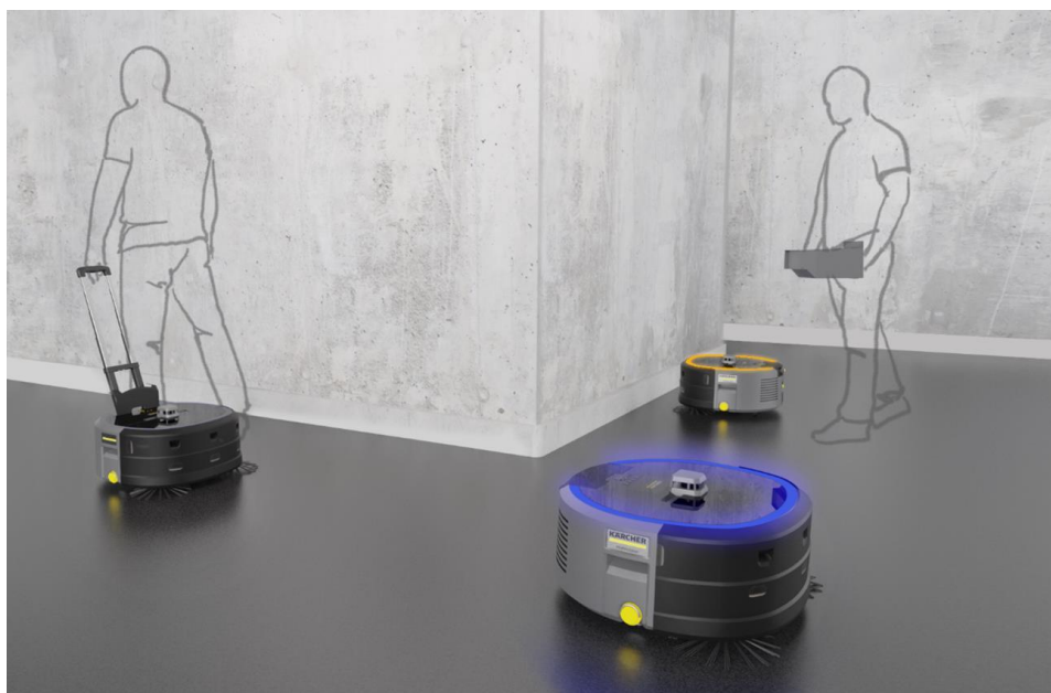
床清掃ロボット KIRA CV 50（参考出展）