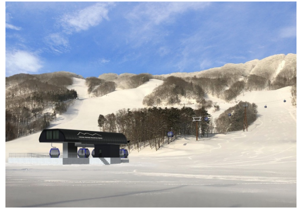
新ゴンドラリフト施設外観イメージ