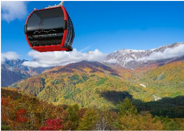
新ゴンドラリフトキャビンのイメージ

株式会社岩岳リゾート（本社：長野県北安曇郡白馬村、代表取締役社長：和田寛、以下「岩岳リゾート」）は、世界水準のマウンテンリゾート化の実現に向け、総額 21 億円を投資し「白馬岩岳マウンテンリゾート」内に輸送力・耐風性・静粛性に優れた新ゴンドラリフトを導入することを決定いたしました。開業時期は 2024 年 12 月を予定しております。