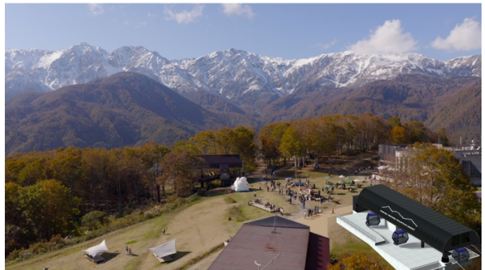
新ゴンドラリフト施設外観イメージ