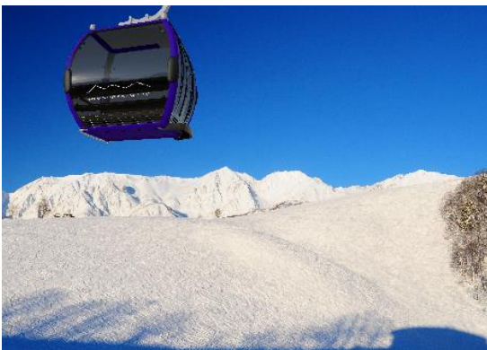
新ゴンドラリフトキャabinのイメージ

なお、既存ゴンドラリフトについては、新ゴンドラリフトの営業開始までは現行通りの営業を続け、新ゴンドラリフト完成後に解体を行う予定です。