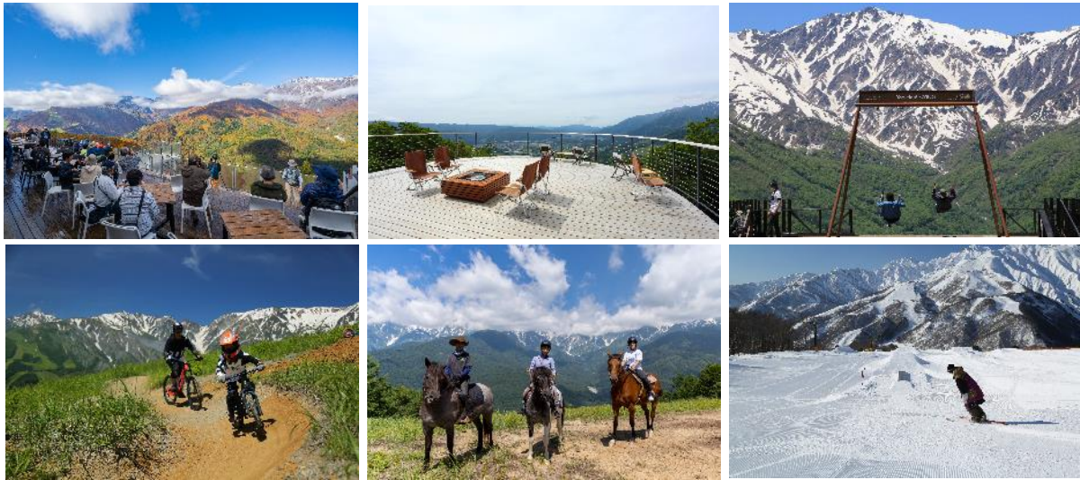
(左上から) HAKUBA MOUNTAIN HARBOR、白馬ヒトトキノモリにある CHAVATY HAKUBA のテラス、ヤッホー！スウィング presented by にゃんこ大戦争、白馬岩岳 MTB PARK、ホーストレッキング、サウスグレンド