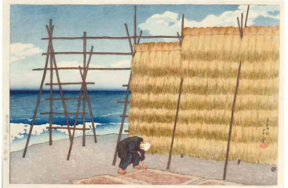
《旅みやげ第一集 秋の越路》大正9(1920)年