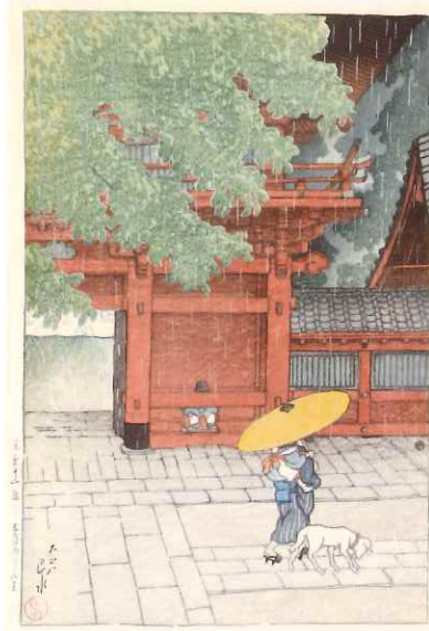
《東京十二題 五月雨ふる山王》大正8(1919)年