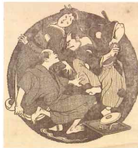
古今亭志ん生「棒鱈」挿絵 (『東京日日新聞附録 講談と落語』所収) 大正14(1925)年3月5日号