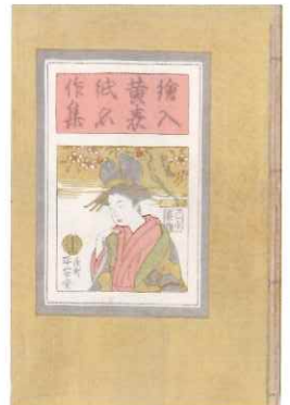
関根黙庵編『絵入黄表紙名作集』 表紙 大正11(1922)年2月刊