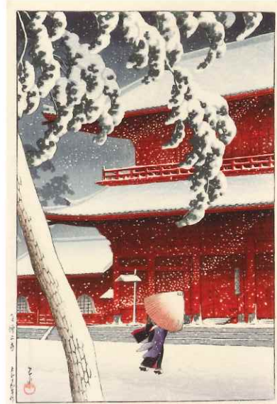
《東京二十景 芝増上寺》大正14(1925)年