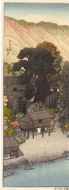
《塩原しほがま》大正7(1918)年