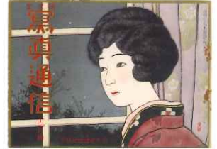
『写真通信』第154号 表紙 大正15(1926)年12月号