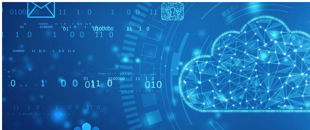
図：柔軟なクラウドソリューション

また、設定済みのHPCアプライアンスを簡単に作成できます。ユーザーは、好みのクラウドプロバイダー上でプライベートアプライアンスを作成し、シミュレーションソルバーや、流体力学やバルクおよび粒状材料シミュレーションの可視化に最高の計算ハードウェアを利用でき、GPUノード上でもアプリケーションを実行できます。Altair Unitsのバリューベースのライセンスシステムを通じてアルテアのソリューションにアクセスすることで、既存のHPCへの投資を社内、クラウド、オンデマンド、ハイブリッドで最大限に活用できます。