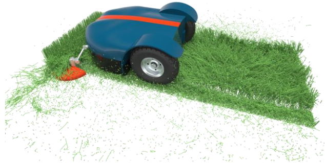
図：Altair EDEMによる刈り取りシミュレーション

アルテアの統合ソフトウェアソリューションにより、製品ライフサイクルのあらゆる段階において、確かな情報に基づいた意思決定を行えるようになります。Simulation 2022.2は、アルテアのシミュレーション製品間の統合を改善し、プロジェクト管理の合理化とリードタイムの短縮を実現します。Simulation 2022.2では、HyperWorks、HyperMesh、Altair Pulse、HyperWorks CFDが大幅に改良されています。