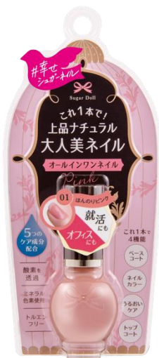
シュガードール オールインワンネイルR 7mL ¥990 (税込)