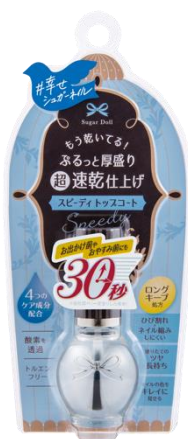
シュガードール スピーディトップコートR 7mL ¥990 (税込)