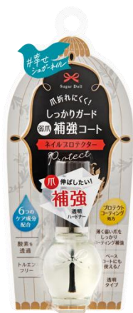
シュガードール ネイルプロテクター 7mL ¥990 (税込)