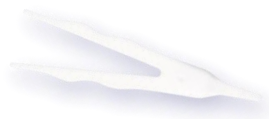
独自設計のY字スティック