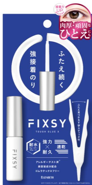
フィクシー タフグルーX <ふたえまぶた化粧品>

肉厚・頑固なひとえも簡単にキレイなふたえを作れるふたえまぶた化粧品と、 ふたえまぶた化粧品や濃いポイントメイクを素早く落とすことができる ポイントメイクアップリムーバーがエリザベスより同時発売。