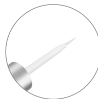
ムラなく塗りやすい筆

液含みと肌あたりが良い、ムラなく塗れる筆と、 握って幅を調節できるオリジナルのY字スティックを採用。