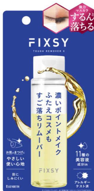
フィクシー タフリムーバーX <ポイントメイクアップリムーバー>