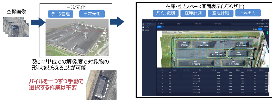
パイルの在庫量や空きスペースなどの自動識別・計測のイメージ

さらに、生成された三次元データから、パイルごとの原料銘柄や重量などが記載された帳票を CSV 形式で出力することができ、従来、手入力で行っていた帳票化を自動化し、業務負荷の軽減や在庫管理の効率化を支援します。