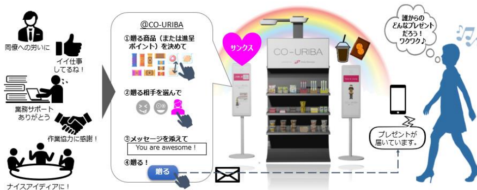
「CO-URIBA」のありがとうクーポンの活用イメージ