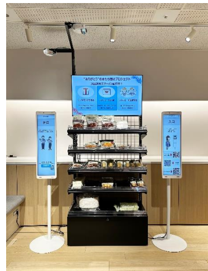
オカムラのオフィスに設置した「CO-URIBA」