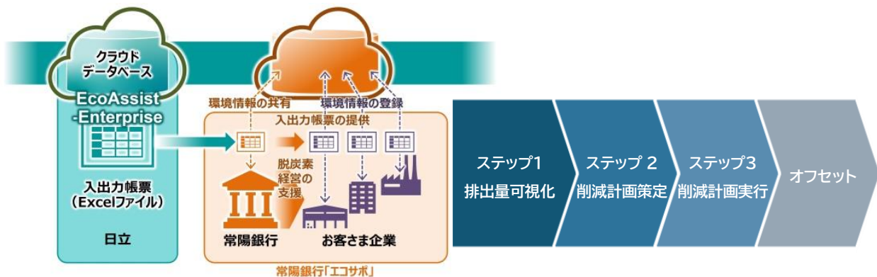
【「エコサポ」のサービス提供概念図と CO2 削減に向けた脱炭素コンサルティングのイメージ】